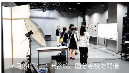
6月24日(土) 渋谷校、国分寺校で開催

カット、アップ、メイクアップ、ネイル、着付、ワインディング、シェービング…。多彩な美容・理容技術にチャレンジしてみましょう！在校生がみなさんの技術指導をしながら一緒に進みますので、聞