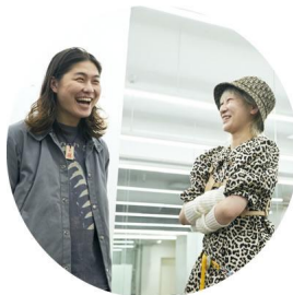
AMANEさん 重水 桃夏さん LECO