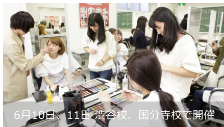
6月10日、11日 渋谷校、国分寺校で開催