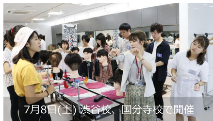
7月8日(土) 渋谷校、国分寺校で開催

通常のオープンキャンパスと異なり規模を縮小して実施するイベントです。じっくりと相談できるイベントの為、実際の学校生活についてなど気になることも質問してみ